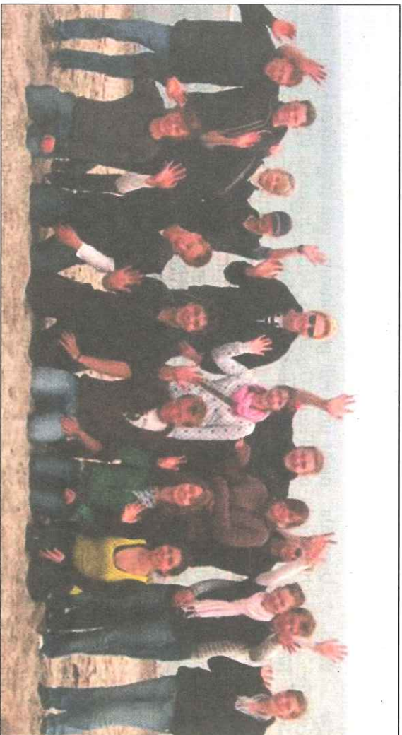
35 Mitglieder hat die Landjugend Schwansen für die 72-Stunden-Aktion vom 14. bis 17. Mai nommiert.